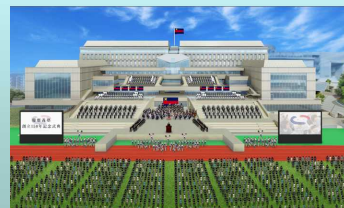
式典イメージ図（実際の演出とは異なります）

会場：実施会場 日吉キャンパス陸上競技場 中継会場 三田キャンパス・湘南藤沢キャンパス・大阪会場 大阪会場（堂島リバーフォーラム） 当日のプログラムは、上記 Web サイトをご覧ください。